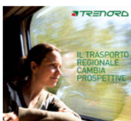
Ads by Trenord

L'organizzazione dell'evento sarà magistralmente seguita dall'associazione AMP, American Motors Pavia e Sadurano Motorsport per la gestione tecnico-sportiva della gara. L'aeroporto di Rivanazzano Terme è raggiungibile dalle autostrade A7 (uscita Casei Gerola) e A21 (uscita Voghera).